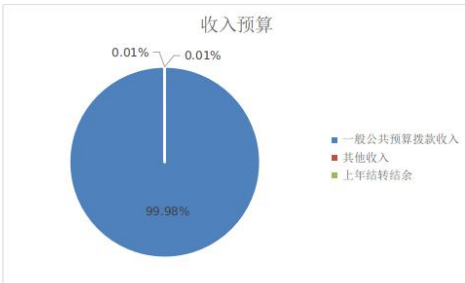
图 1: 收入预算