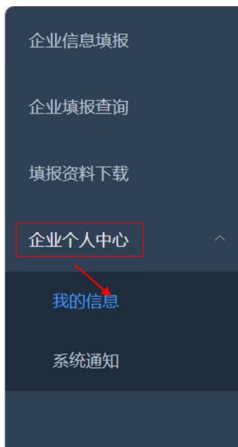
图 2-8 企业账号信息修改页面

企业名称、企业类型、手机号、邮箱等账号信息需要修改时，可以点击左侧【企业个人中心-我的信息】进入修改页面。