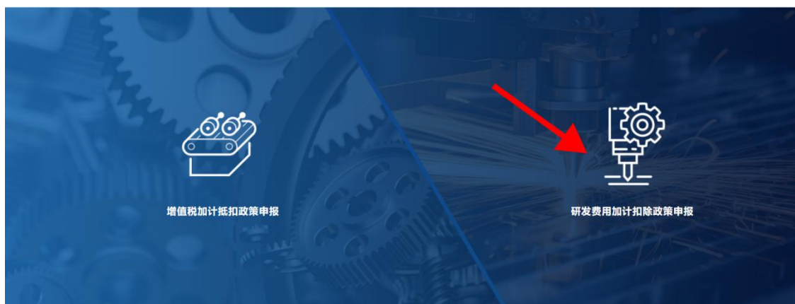
图 2-1 系统页面

新用户登录页面点击【立即注册】按钮，进入注册页面。申报企业使用“登录名+密码”或者手机号验证码方式进行系统登录。如已注册 2023 年度增值税加计抵减政策申报系统的企业，可以直接使用已注册的“用户名+密码”或者手机号验证码登录，无需重复注册。