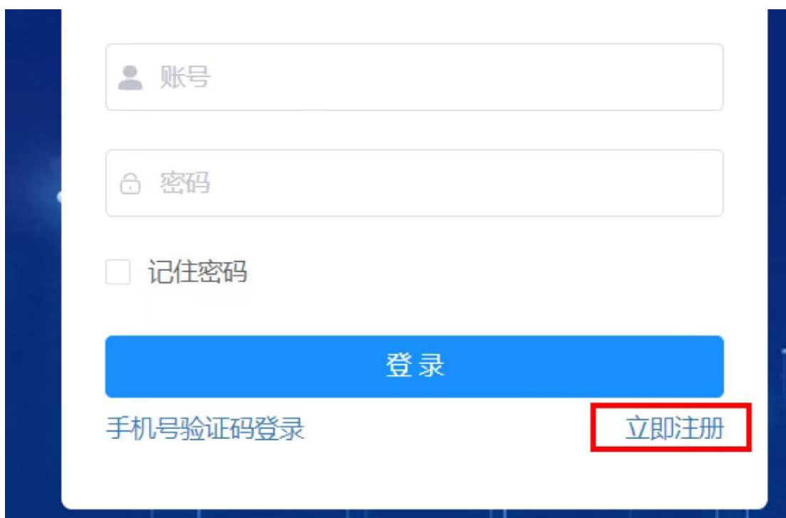
图 2-2 登录页面

新用户登录页面点击【立即注册】按钮，进入注册页面。申报企业使用“登录名+密码”或者手机号验证码方式进行系统登录。如已注册 2023 年度增值税加计抵减政策申报系统的企业，可以直接使用已注册的“用户名+密码”或者手机号验证码登录，无需重复注册。